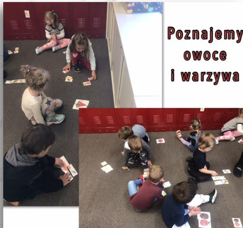
Poznajemy owoce i warzywa